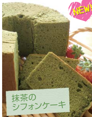
抹茶のシフォンケーキ

お一人で「計量」から「焼き上げ」まで、仕上げていただく、手ごねスタイルのレッスンです。初心者でも安心!!