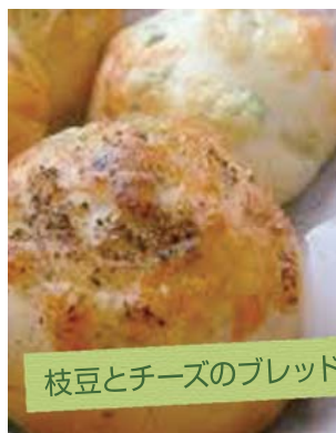
枝豆とチーズのブレッド